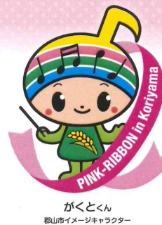
がくとくん 郡山市イメージキャラクター